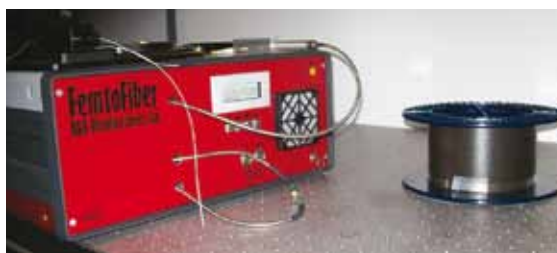
A FIBERSC2 projekt során kifejlesztett, ipari kivitelű, szálintegrált pikoszekundumos Yb-szállézer és erősítő rendszer

MTA Wigner SZFI-ben például speciális tulajdonságú optikai szálak megtervezését (lásd Várallyay és Szipőcs, IEEE-JSTQE, 2014 ), illetve az R&D Ultrafast Lasers Kft. és a Szegedi Tudományegyetem Optikai és Kvantumelekttronikai Tanszékének segítségével ezekből mintadarabok gyártását, tesztelését és minősítését (lásd Grósz és társai, Appl.Opt, 2014 ) végezték el. Ugyancsak feladat volt, hogy a korábban elkészített femtoszekundumos szállézer prototípusából (lásd Fekete és társai, Laser Phys. Lett., 2009 ) ipari célra is alkalmazható változatot készítsenek, azaz olyat, ami folyamatos, zavar- (például Q-kapcsolástól) mentes módusszinkronizált működésre alkalmas, ezért megfelelően stabil és biztonságos fényforrásként használható a mikroendoszkópiás rendszerekben. Ezeknek a hagyományos szilárdtestlézeres megoldásokkal szemben az a nagy előnyük, hogy kisebb helyen elférnek, lényegesen olcsóbbak, illetve – mivel egy optikai szálból jön ki a fény –, endoszkópiás rendszerekbe is könnyebben integrálhatóak. Hátrányuk csupán annyi, hogy a szállézeres tipikusan egy szűk hullámhossztartományban működnek – az itterbium lézer körülbelül az 1 mikrométeres hullámhosszon, míg a telekommunikációs megoldásokban használt erbiumalapú szállézer megközelítőleg az 1,5–1,6 mikrométeres hullámhossztartományon. Ugyanakkor az itterbiumra épülő rendszerek nagyon nagy hatásfokon dolgoznak, azaz az