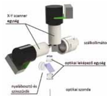
7 mm hosszú, 1 mm átmérőjű „optikai szondával” ellátott, mobiltelefon méretű kétfoton mikroszkóp terve

A jelenlegi fejlesztési irány az extrém, ami a kiváló felbontást és a mikroszkóp kis méretét is jelenti, nemlineáris mikroszkópok előállítására. Például kísérleti fázisban van egy mindössze egy milliméteres átmérőjű optikai mérőszondával ellátott endoszkópos kétfoton mikroszkóp, amivel az agy akár több milliméteres mélységben is in vivo vizsgálható.